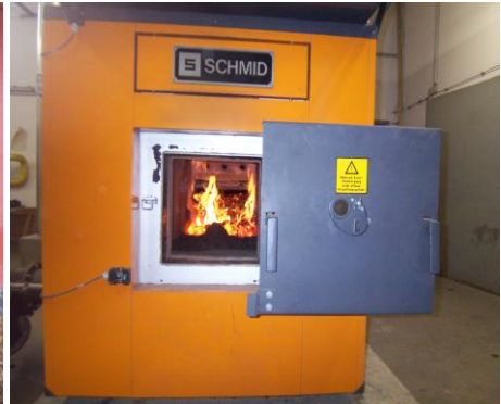
Schmid-Kessel mit Unterschubfeuerung

Marie-Durand-Schule Bad Karlshafen, Inbetriebnahme 2002, Kesseltechnik Polytechnik 350 kW, durchschnittlicher Jahresverbrauch 1100srn/a.