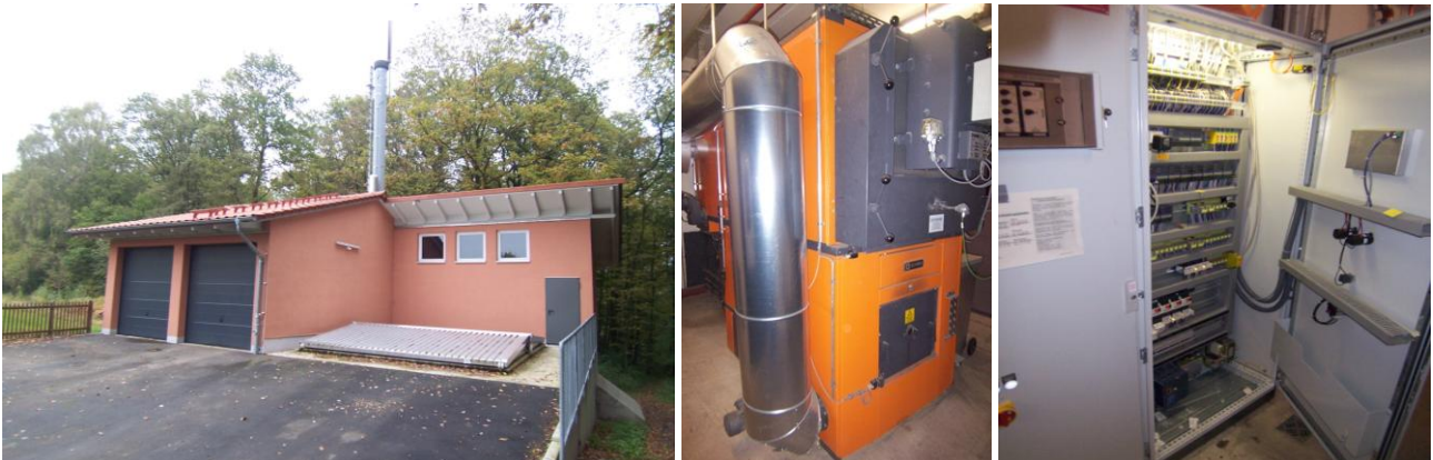
Holz hackschnitzellager mit Heizungsgebäude