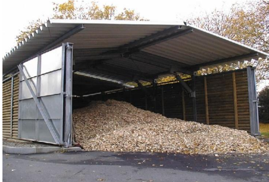
Blick in das Hackschnitzelvorratsgebäude Förderkette des Brennmaterials