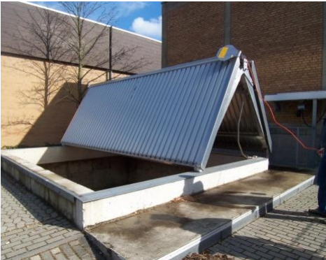
Rolltor zum Hackschnitzellager

Wilhelmstalschule in Calden, Inbetriebnahme 2003, Kesseltechnik Schmid Pyrotronik 300 kW durchschnittl. Jahresverbrauch 1400srn/a