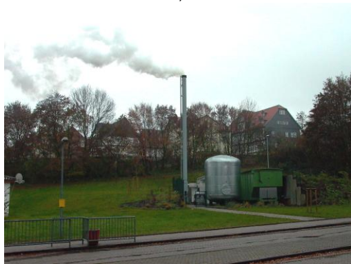
Anlage im Außenbereich

Inbetriebnahme 2003, Kesseltechnik Schmid Pyrotronik 550 kW durchschnittl. Jahresverbrauch 1400 srm/a